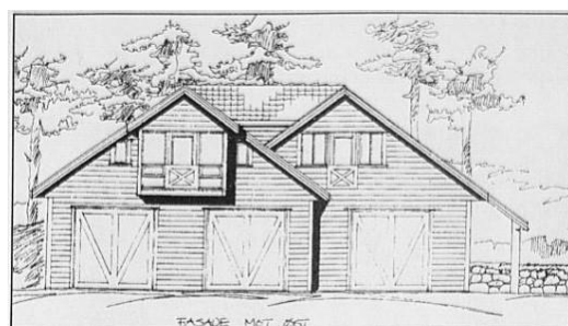
Slik vil Stavanger Roklubs nye naust ved Stokkavannet bli seende ut. I forhold til disse tegningene skal balkongen og vinduene oppe til venstre fjernes og vinduene på høyre side skal settes sprosset.

Det er nå ca 17 år siden vi flyttet inn i båtnaustet på Stokka, etter «11 års kamp» med reguleringsplaner og tillatelser. Tomt ble tildelt i 1995, men året etter måtte en nesten gi opp etter innsigelser fra Fylkesmannen. Men i mai 1997, etter to nei, sa Fylkesmannen ja til planene om hus ved Store Stokkavann og «klubben får lov til å sette opp et naust». Torsdag 26.juni 1997 vedtok Kommunalstyret for byutvikling enstemmig og uten diskusjon at Stavanger Roklub får bygge båtnaust. Og senere i oktober ga både formannskap og bystyre grønt lys, og en kunne begynne å søke om byggetillatelse. Over vises en tidlig tegning som måtte endres, bl a måtte balkongen og vinduet til venstre fjernes.